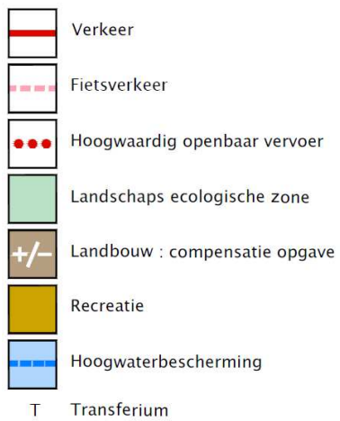
Figuur 2: Overzichtskartaart ruimtelijke maatregelen GOL Oost