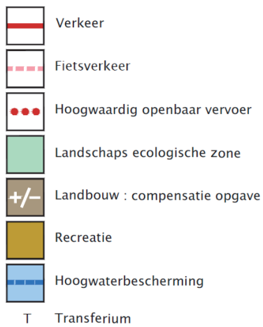
Figuur 2: Overzichtskaart ruimtelijke maatregelen GOL Oost