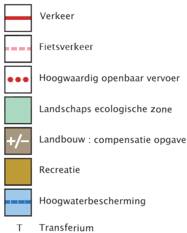
Figuur 1: Overzichtskaart ruimtelijke maatregelen GOL West

De GOL Oost kent de volgende concrete maatregelen: